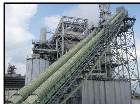
搬送設備の設計・製作・据付

日南事業部のスタッフが迅速で高度な技術力で設計・製作・据付からアフターサービスとメンテナンス迄を提供致します。