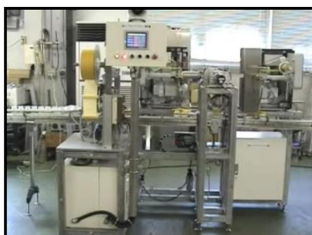
自動包装設備の設計・製作