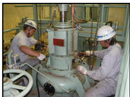
設備のメンテナンス