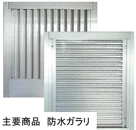
主要商品 防水ガラリ